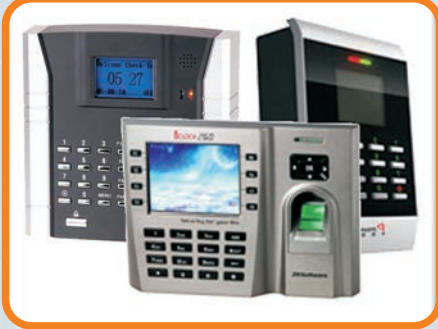
KART VE PARMAK İZİ OKUYUCULAR