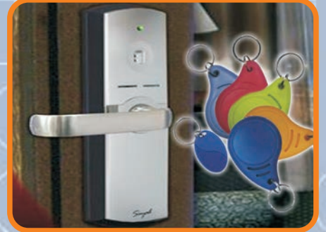
RFID KAPI KİLİT SİSTEMLERİ