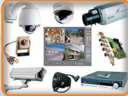
KAMERA VE GÜVENLİK SİSTEMLERİ