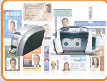
KART BASKI SİSTEMLERİ