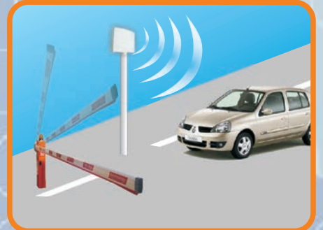
RFID ARAÇ GEÇİŞ SİSTEMLERİ