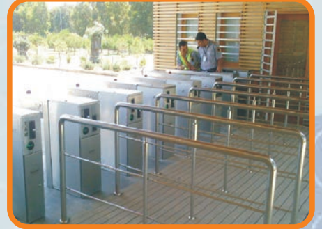
TURNİKELİ GEÇİŞ SİSTEMLERİ