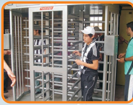
BİLETLİ ve KARTLI GEÇİŞ SİSTEMLERİ