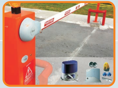
OTOMATİK KAPI VE BARIYER SİSTEMLERİ