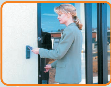
PERSONEL DEVAM KONTROL SİSTEMLERİ