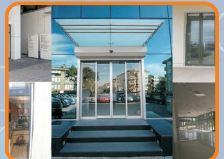
SÜRGÜLÜ KAPI SİSTEMLERİ