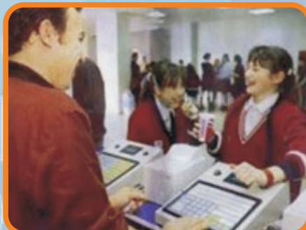
KAMPÜS VE KANTİN SİSTEMLERİ